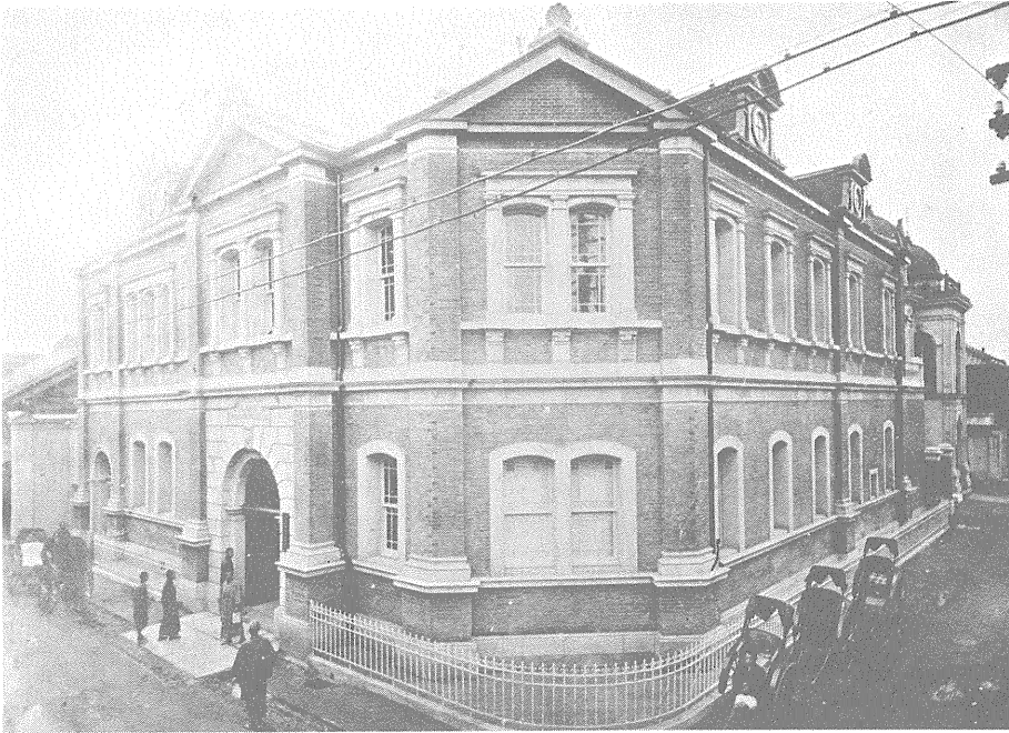
開業時の当行本店 七十四銀行本店を引継いだもの