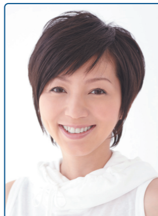
わたなべ・まりな 1970年東京生まれ。1986年デビュー。清潔感あふれる明るいキャラクターでテレビ、CM、ラジオ、執筆など、さまざまなジャンルで活躍中。趣味は、読書、映画・音楽鑑賞、体づくり。

たり、子どもの反応は鋭いです。最後に、満里奈さんから女性へ、そして子どもたちへのメッセージをお願いします！ 日々バタバタと過ごして、もっと上手に時間が使えたらいいの！と思った日もするけど、一瞬一瞬の何でもない積み重ねがとて愛おしい毎日です。大変と思ったら大変だし、愛おしいと思ったら愛おしい。生活の充実や満足は、自分の気持ちひとつだなと思うんです。だから皆さん、一緒に頑張りましょうね！そして子どもたちは可能性のかたまり未来そのもの。とてもまぶしい存在です。夢は大きく、好きなことと信じることに向かって突き進んでください！