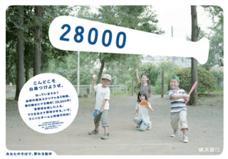
夢みる数字 vol.3「野球」篇 2009年10月～12月